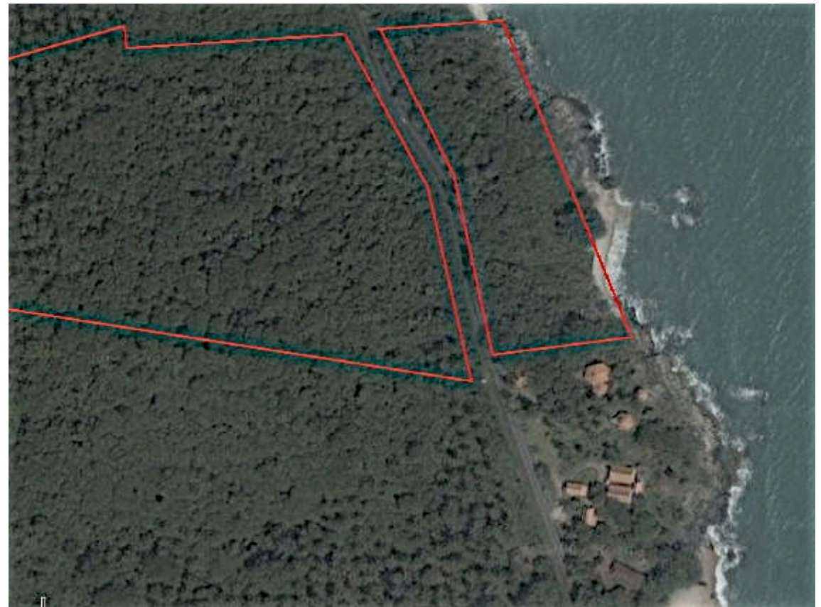
left: greater area